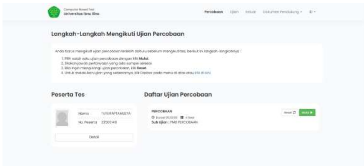
Gambar 2. Tampilan Ujian Percobaan Tes CBT.

Jalan Teuku Umar, Lubuk Baja, Kota Batam-Indonesia, Telp. 0778 – 408 3113 Email : info@uis.ac.id / uibnusina@gmail.com Website : uis.ac.id